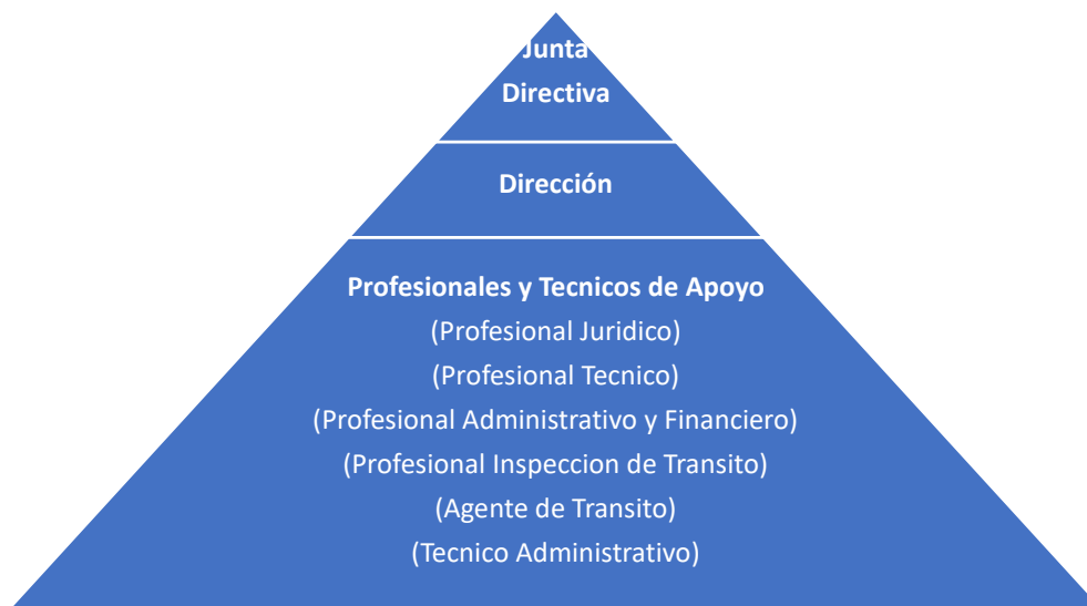
Figura 1. Pirámide de Jerarquía de IDTRACESAR según manuales y planta de personal